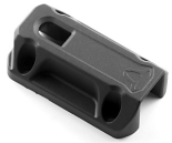
2 Satteltaschenbügel Unterteil Connector-Part Female