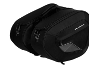
18 Satteltaschen Panniers